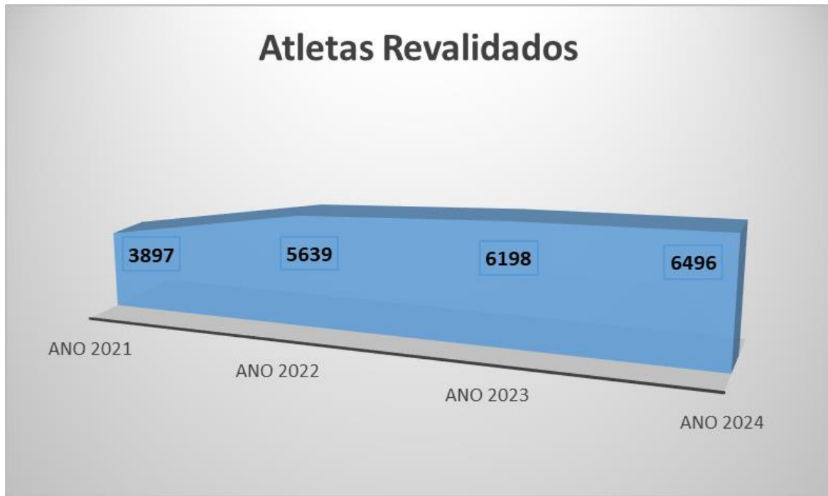
Gráfico 1 – Evolução do número de atletas desde 2021

Continua a existir uma diferença significativa (2966) entre o número de atletas revalidados femininos e masculinos (Gráfico 2), contudo continua a reflectir-se uma tendência crescente de atletas do género feminino.